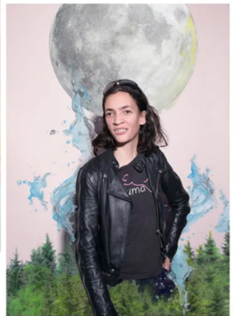
Outsideinsideout, van DEGASTEN.

Niet meer dan een bureau, bed, kast en een badkamertje met douche en toilet. De zes maquettes die in de gestripte theaterzaal van Frascati in Amsterdam staan opgesteld, zijn vrijwel identiek. Het zijn de leefruimtes van zes jongeren uit een Rijks Justitiële Jeugdinstelling. Kamers van iets meer dan twaalf