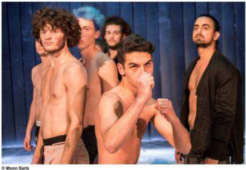
Scene uit 'We the People'.

In 2017 zijn er 11.639 bezoekers en deelnemers bereikt, liepen er 22 jongeren stage bij DEGASTEN, werden er 106 workshops gegeven, zijn er minimaal 10 spelers doorgestroomd naar het kunstvakonderwijs en er werd getoerd met 5 verschillende voorstellingen.