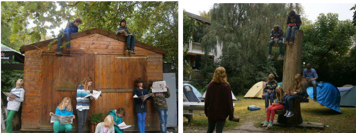
Presentatie Hyperion lyceum in de Tolhuistuin

In opdracht van het Hyperion Lyceum (Amsterdam Noord) en de Tolhuistuin maakten 3 docenten en 4 peer educators van DEGASTEN binnen 3 dagen een locatievoorstelling met 60 brugklassers van het Hyperion Lyceum. De eindpresentatie werd gehouden in de Tolhuistuin i.s.m. Solid Ground Movement en de Filmonauten, voor ruim 450 bezoekers, waaronder 180 scholieren.