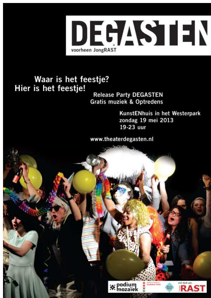
Flyer releaseparty DEGASTEN

Omte vieren dat DEGASTEN een nieuwe stichting is en niet meer Jong RAST heet en om het seizoen voor de trainingsgroepen af te sluiten, gaven we in en rondom het KunstENhuis (in het Westerpark) een groot feest en drie locatievoorstellingen voor onze achterban en de buurtbewoners.