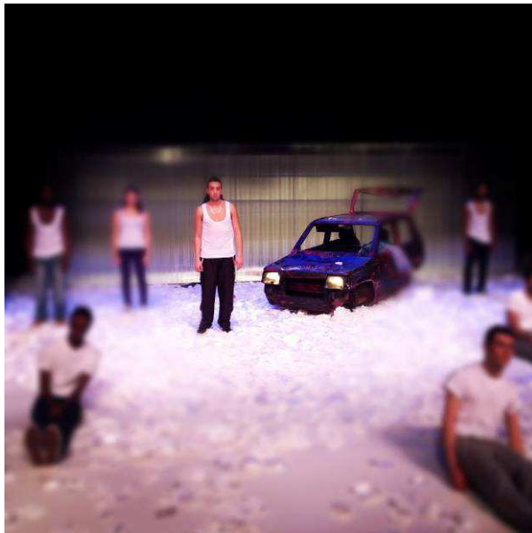
Scene uit de voorstelling ONE

In opdracht van de AHK Theaterschool afdeling Theaterdocentenopleiding werd de productiegroep voorstelling ONE gespeeld op het afscheidsfeest van artistiek leider Bruin Otten.