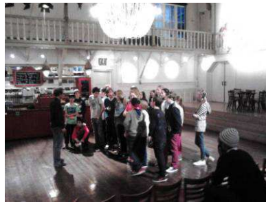
Workshop St Ignatius Lyceum in de Krakeling

Het 1 e jaar VWO van het st Ignatius Lyceum uit Amsterdam Zuid kwam naar de voorstelling 'Stuck in the Middle with you' in de Krakeling. Zij kregen een voorbereidende workshop waarin ze zelf met het thema aan de slag gingen.