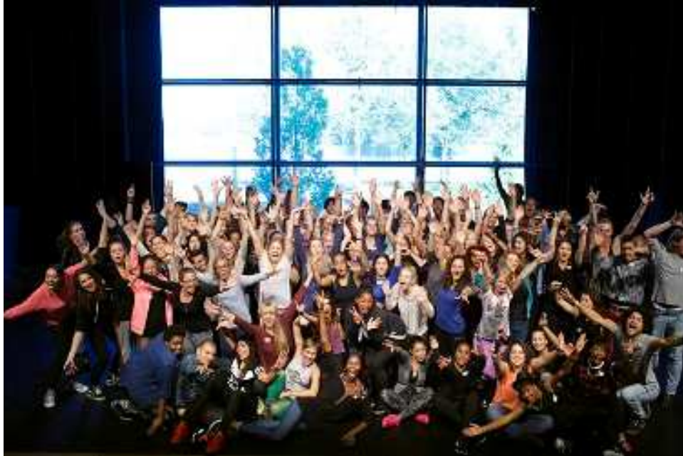
Groepsfoto auditedag - 2013