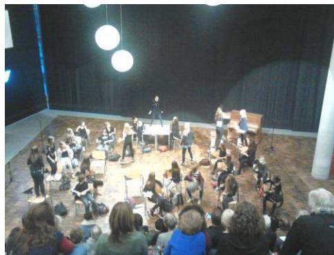
Presentatie door St Nicolaas Cultuurklas – nov 2013

Lessenreeks geven en eindpresentatie maken met de eerstejaars cultuurklas in Amsterdam Zuid.