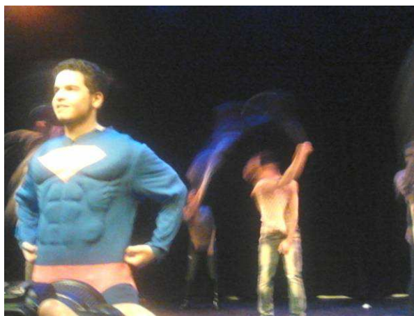
Scenefoto van DEGASTEN voorstelling op het Kerstbal

Samen met Nowhere, Solid Ground Movement, Poetry Circle en Spin Off organiseerde DEGASTEN het kerstbal. Op deze avond kunnen jonge Amsterdamse makers laten zien waar ze mee bezig zijn, binnen verschillende disciplines voor een jong publiek.