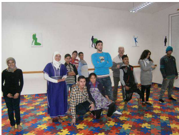
Repetities in Larache, Marokko - familieportretten