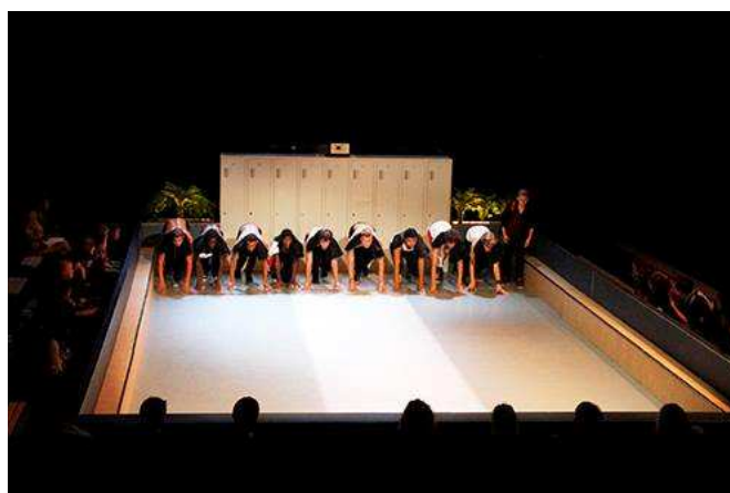
Flyer + foto voorstelling Stuck in the middle with you.