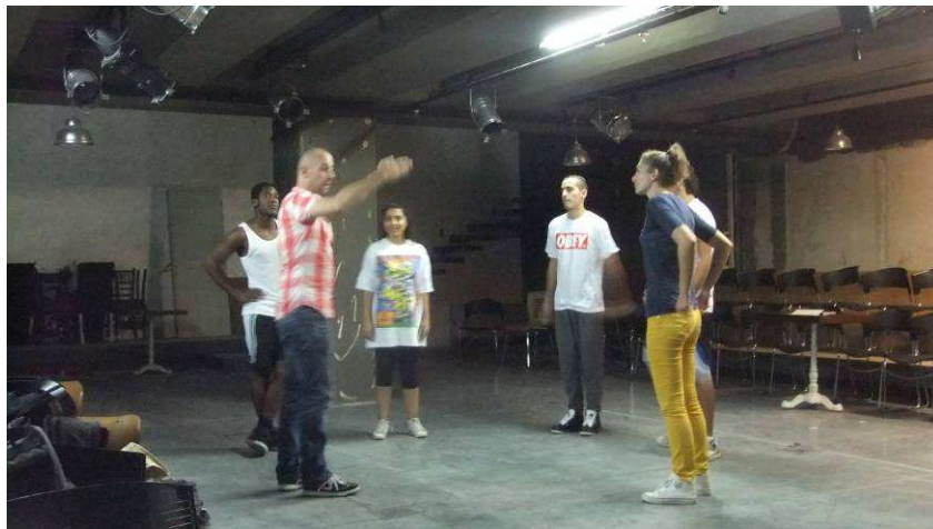
Repetities Arada Istanbul

In 2012 heeft DEGASTEN een uitwisseling gedaan met het Arada Istanbul Festival. Een aantal jongeren uit Amsterdam en uit Istanbul hebben gezamenlijk een voorstelling gemaakt onder regie van DEGASTEN, in Istanbul. Om de uitwisseling af te sluiten, gaf op 14 januari 2013 de choreograaf Serkan Bozkurt van Arada Istanbul festival choreografie les aan onze spelers in Amsterdam.